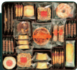
花のティータイム 6号 [12種(745g 54個)] ¥3,000(税込¥3,240)