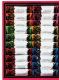
ミルフィーユ 4号 [ 6種 (20個) ]

ヘーゼル×5, アーモンド×5, ストロベリー×5, オレンジ×5, コーヒー×5, アールグレイ×5