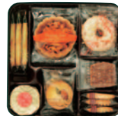
花のティータイム 2号 [7種(255g 18個)] ¥1,000(税込¥1,080)