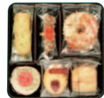
花のティータイム 1号 [6種(120g 11個)] ¥500(税込¥540)