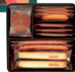
貴婦人の街角 1号 〔6種(105g 15個)〕 ¥500(税込¥540)