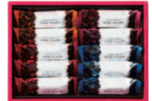
ミルフィーユ 2号 [ 4種 (10個) ]