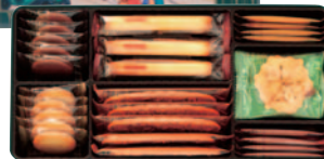
貴婦人の街角 2号 〔7種(225g 31個)〕 ¥1,000(税込¥1,080)