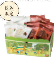
チョコレート ラスク 18枚 ¥1,200(税込¥1,296) ミルクチョコレート・ラスク×8 ホワイトチョコレート・ラスク×8 ホワイトチョコレート・ラスク×4