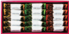
ミルフィーユ 6号 [ 6種 (30個) ]