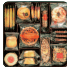
花のティータイム 4号 [12種(505g 35個)] ¥2,000(税込¥2,160)