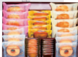
ベルクの町 6号 〔6種(35個)〕 ¥3,000(税込¥3,240)