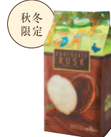
チョコレート ラスク 〔8枚〕 ¥500(税込¥540)

カリン・ブルーメのラスクは、おいしさを追求するためにフランスパン作りから始めました。 サクサクと軽い食感と風味豊かな味わいを皆様にお届けいたします。