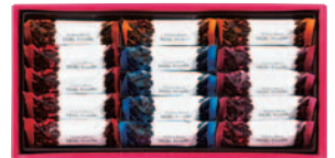
ミルフィーユ 3号 [ 4種 (15個) ]

ヘーゼル×4, アーモンド×4, ストロベリー×3, オレンジ×3, コーヒー×3, アールグレイ×3