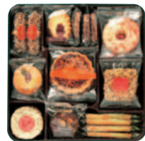
花のティータイム 3号 [10種(390g 26個)] ¥1,500(税込¥1,620)