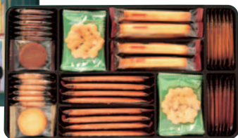
貴婦人の街角 4号 〔7種(470g 64個)〕 ¥2,000(税込¥2,160)