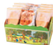
ラスクアソート 2号 〔15袋(23枚)〕 ¥1,000(税込¥1,080) シュガーバター・ラスク×8袋(2枚入) フロランタン・ラスク×7袋