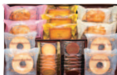
ベルクの町 4号 〔6種(27個)〕 ¥2,000(税込¥2,160)